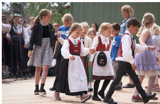
Frå Bygdøystemnet på Norsk Folkemuseum.